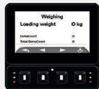
▲ Affichage pendant le pesage

L'opérateur peut prédéfinir une limite de charge maximale, et un avertisseur sonore se déclenche lorsque cette limite est atteinte. Cela permet de prévenir les accidents dus à la surcharge.